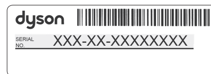
Immagine a scopo puramente illustrativo.

Il numero di serie si trova nell'angolo inferiore destro della contropiastra, sul modulo di registrazione all'interno della confezione e sul grande adesivo informativo presente intorno al rubinetto una volta disimballata l'unità.